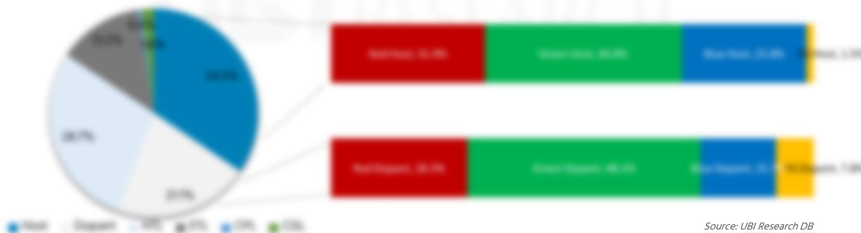
OLED 발광재료별 매출액 점유율