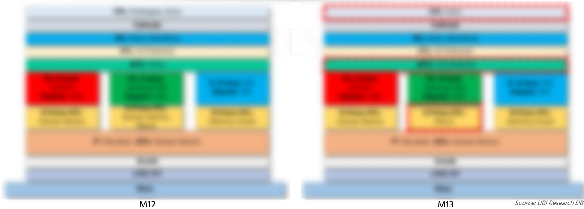
M12(좌)과 M13(우) 구조에 사용된 재료별 supply chain