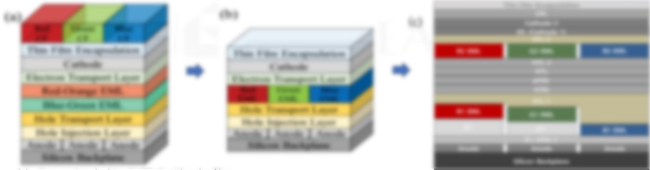
(a) Conventional white OLEDoS with color filter